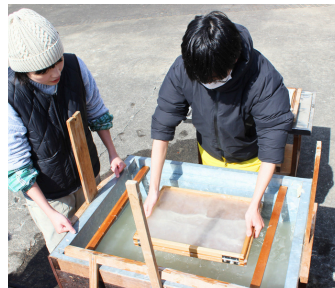
先人の知恵を学ぶ