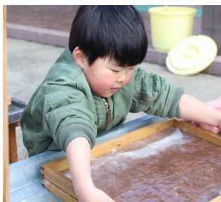
紙すきっておもしろいね