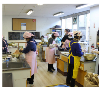
食改さんありがとう