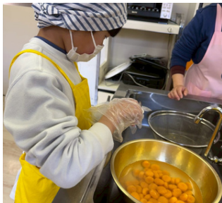
白玉団子美味しくな-れ