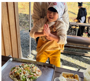
好きな具材をのせて