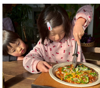
感謝していただきます