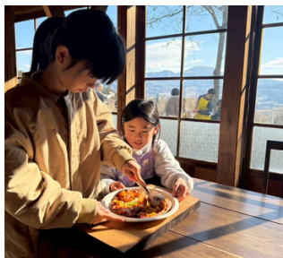
美味しさにびっくり！