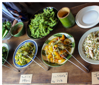
感謝していただきます