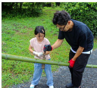
竹を切って削って