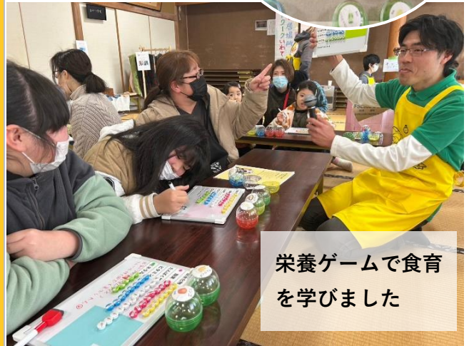
栄養ゲームで食育を学びました